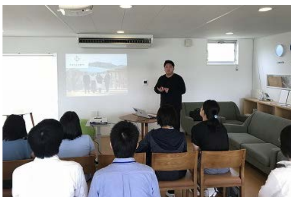
写真11：NPO アスヘノキボウによる 女川の復興の説明