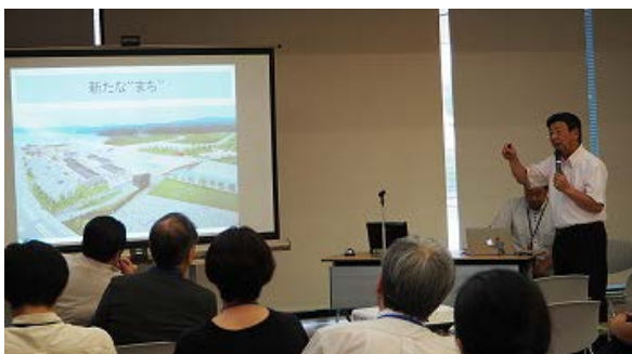
写真 3：南三陸町長による基調講演