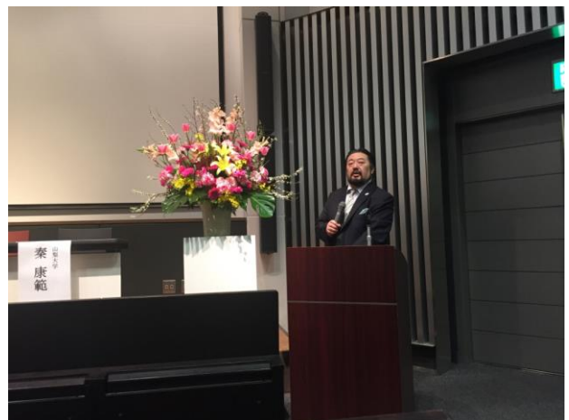
目黒公郎副会長（当時）による閉会の挨拶