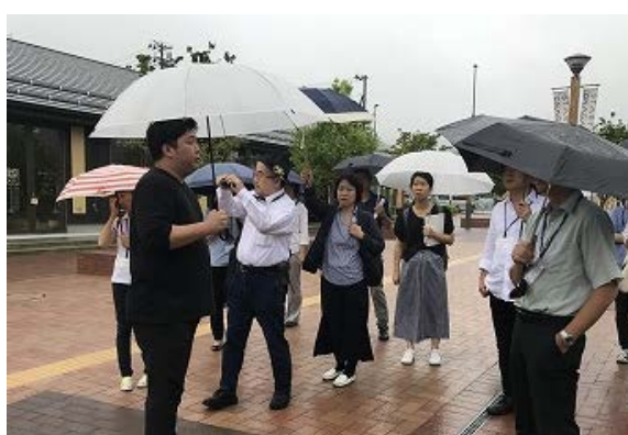
写真12：女川の復興まち歩きの様子