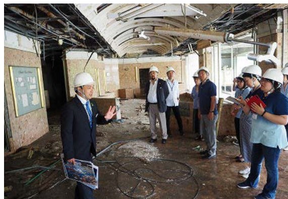
写真10：南三陸町の震災遺構・高野会館 での見学の様子