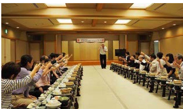
写真 7：南三陸ホテル観洋での懇親会の様子