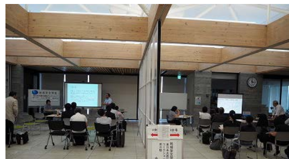
写真 4：研究発表会場の様子