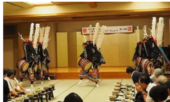
写真 8：南三陸町民俗芸能「行山流水戸辺鹿子踊」