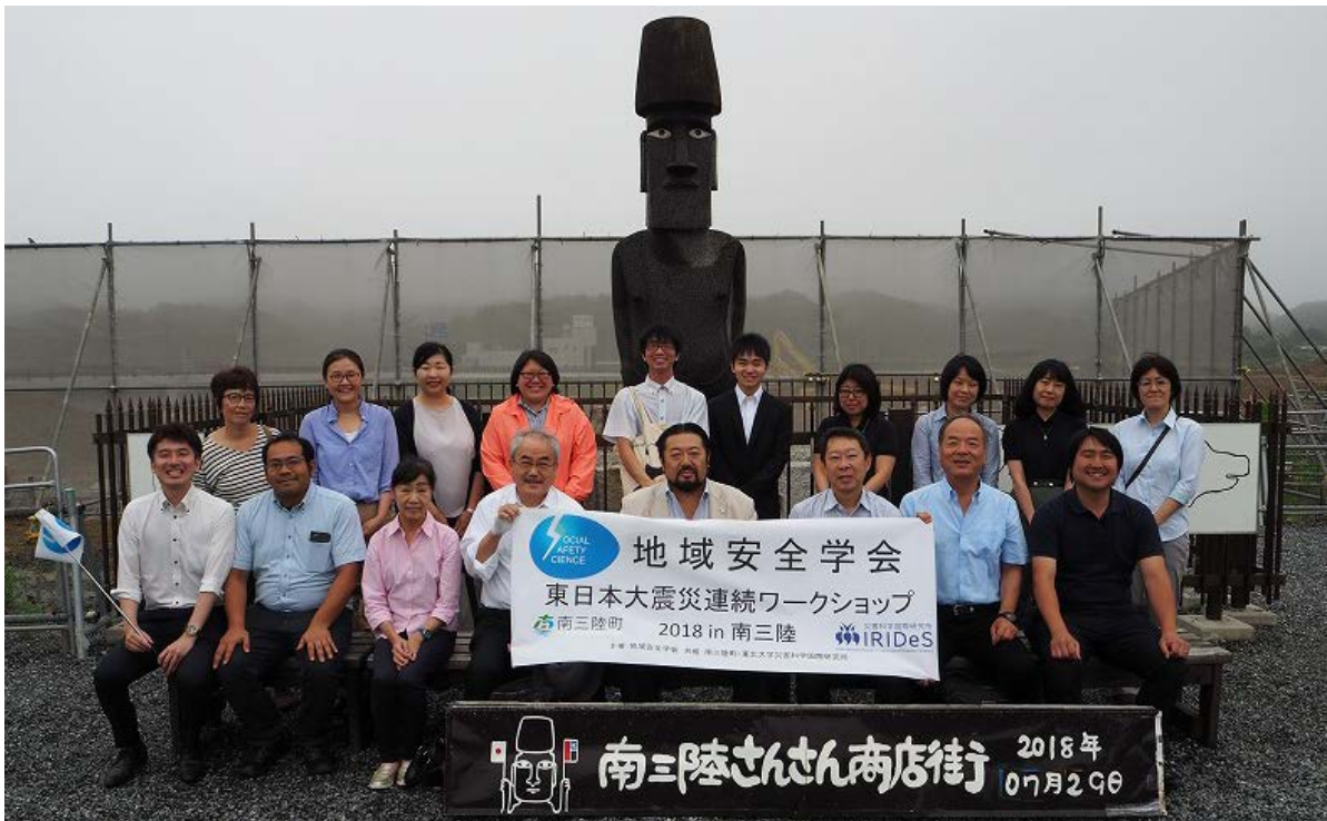
写真13 ワークショップの参加者（1日目、南三陸さんさん商店街のモアイ像前にて）

最後に、1日目の参加者（仙台駅からの送迎バスに乗りいただいた皆様）の集合写真を掲載します（写真13）。