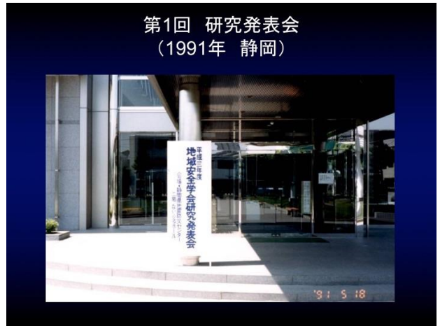
30周年記念スライドショー