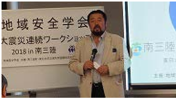
写真 1：目黒公郎学会長の挨拶

能である「行山流水戸辺鹿子踊」の演舞を觀賞し、最後に目黒教授（地域安全学会長，東京大学）から中締めにより懇親会を終了しました。