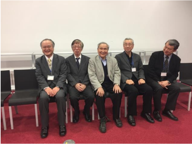
懇親会に出席された歴代会長記念写真