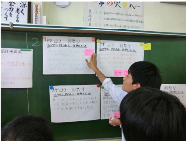
図5 ベスト・プラクティスの投票の様子

「東日本大震災からの復興」では、「人との絆」「人に対する思いやり」こそが活かされた資産であり、それによって、仕事仲間や知り合いからの物資の支援などの形で助けてもらうことが出来た、という事例がベスト・プラクティスとして挙げられた。