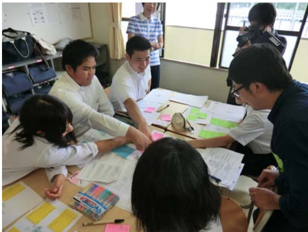
図3 第2回ワークショップの様子(1)

「疑問が残る事例」については、聞き取った本人に詳しい内容を確認した。内容が確認されたのち10事例(5人×2)に順位付けを行い、最終的にベスト・プラクティスを選定した。第1位と第2位を合わせて、ベスト・プラクティスを創ってもよいこととした。