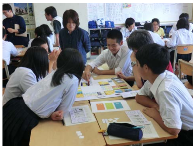
図 2 人生デザインゲームの様子