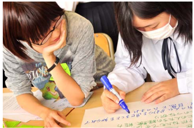
図4 第2回ワークショップの様子(2)

ワークショップ後半は、投票で票が割れた項目について、それぞれの事例に投票した生徒や大学生、大学の教