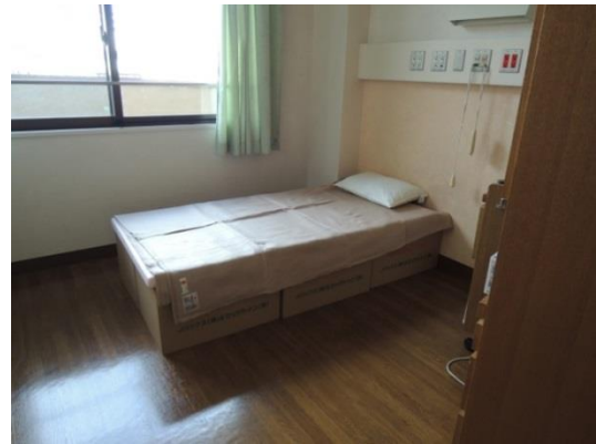
写真1 旧病棟内の段ボールベッド

旧病棟では東館の2階のみ使用された。ベッドも置いてあったが、マットレスが新病棟へ移動しており、段ボールベッドの方が寝心地がよかった。そのため写真1のように段ボールベッドを使用することとなった。