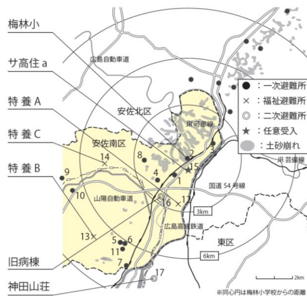
図1 被災地・避難所等位置図

さらに、二次避難所となった広島共立病院旧病棟（以下、旧病棟）と公共の宿泊施設である神田山荘は、それぞれ約2.7km、約6.8kmの距離に位置する。