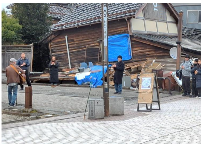
図 3 石川県輪島市の能登半島地震被災現場の一角で、復興応援ソングを歌唱する男性と見物客

視点を変えて、2024年3月下旬の能登半島、輪島朝市の火災現場。元日の大地震の被災地に初めて足を踏み入れた私が目撃したのは、あらゆる色彩と音を失った街だった。あまりに惨い光景に言葉も出なかった。そんな街の一角から響いてきたのが、ギターを片手に弾き語りをする男性の「ガンバロウガンバロウ」という明るい歌声だった。調べてみると、その男性は近くでカフェを営む男性であり、