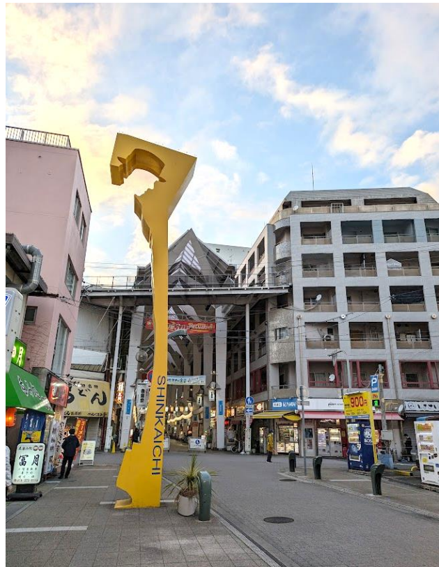
図1 新開地の風景。飲み屋街、マンション、アートなどが混ざり、独特の街並みを形成している。

一方、私は東京の葛飾区新小岩地区のまちづくりの活動に長らく参加させていただいている。新小岩は荒川や中川といった河川に囲まれた低地帯に位置し、水害リスクの高いエリアである。過去にも1910年(明治43年)の関東大水害や、1947年(昭和22年)のカスリーン台風による被害を受けている。現在では、地元町会でボートを保有して訓練をしたり、浸水しても生活が継続できる市街地